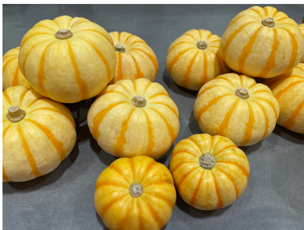
札幌・苗穂駅に店舗を構える相川商店さんが 沢山のプッチーニを このイベントのために集めてくださいました！