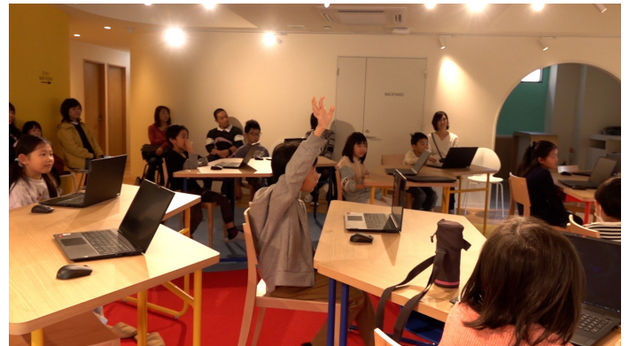
クイズを出したり、進捗具合を確かめながら、子どもたちと対話し授業を進めました