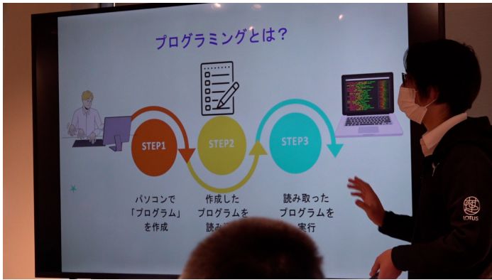
プログラミングとは?の説明

午前の部、午後の部、それぞれプログラミングは、ハロウィンプログラミングと題し、プログラミングでかぼちゃランタン作りに挑戦しました♪