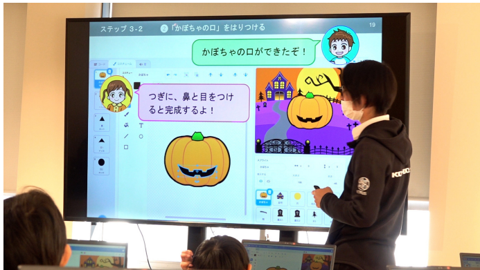
ハロウィンにちなんで、プログラミングでジャックオランタンを作って動かすにチャレンジ