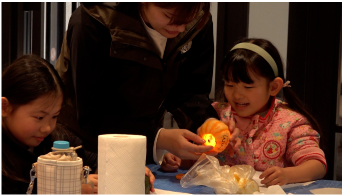
中にLEDろうそくをいれると！ わあ～！光った！