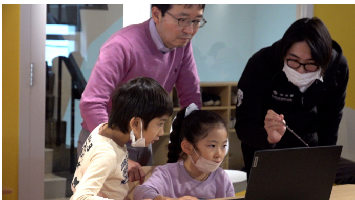
真剣に取り組むこどもたち