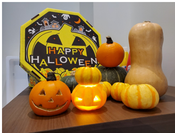
ミニかぼちゃでランタンづくりを体験！ 色んな種類のかぼちゃが集結！