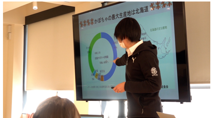
北海道のかぼちゃ生産量日本一! かぼちゃの種類、料理、ハロウィンの由来なども紹介