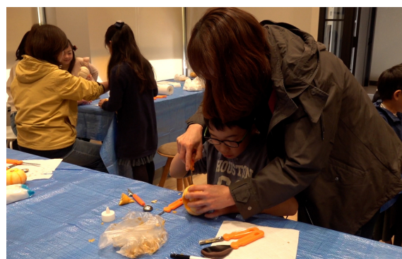
子どもがかぼちゃに書いた顔を親がくり抜く！ 親子で会話しながらとても 和やかなイベントになりました