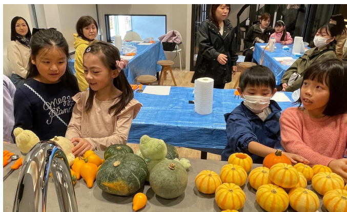
見て触れて感じる大切さ！ どれにしようかな～