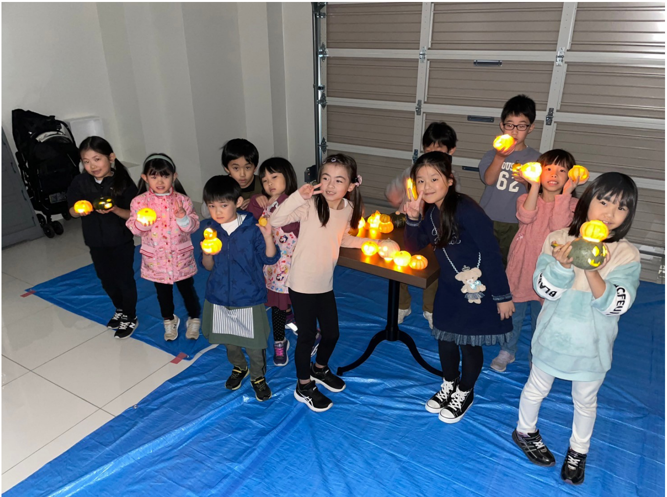
最後はガレージスペースでみんなで記念撮影！ 電気を消すと綺麗に光って大興奮！楽しかったね！