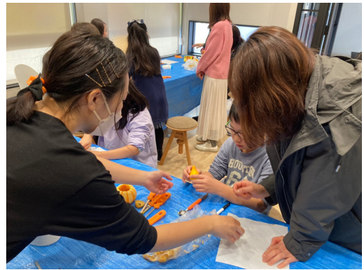
早くできたから2個目を作る子も！